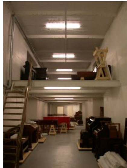
Fra de nye lagrene på Dora

gjorde flyttingen av tunge, uhåndterlige flygler til litt av en utfordring – men ved hjelp av kreative løsninger fra både sterke karer, flyttefirmaets ansvarlige Helge Opland, og vår egen vaktmester Einar Våbenø var alle instrumentene på plass på Dora etter 2 uker.